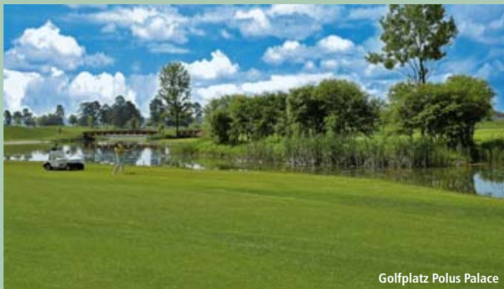
Golfplatz Polus Palace

Golfidylle Pur. In Ungarn können Sie das Golfspiel in lockerer Atmosphäre und in abwechslungsreicher, natürlicher Umgebung genießen.